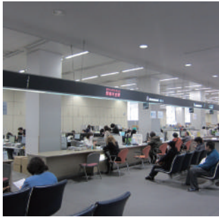
ワンストップサービスが期待される市役所窓口

答弁 （総務部長） 市民からの問い合わせには幅広い事案が考えられるため、コールセンターで対応すべき範囲を整理し、既存業務との関