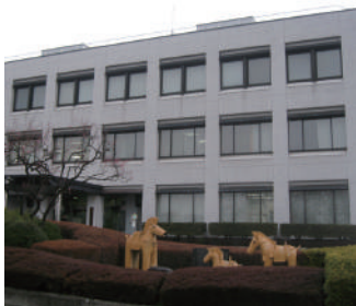
市民活動センターに 近接する群馬支所

センターは、年末年始を除き、午前9時から午後10時まで利用可能。ただし、市民ホールや学習室などの利用は、事前に団体登録が必要で、すでに2月1日から予約が開始されています。センター南側には、2900㎡の芝生広場が整備される予定で、多くの市民が集う、活気あふれるセンターが期待されます。