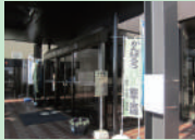
岩手県一関市役所