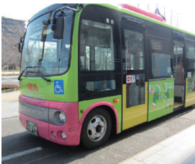
市内循環ぐるりんバス

答弁 （福祉部・子育て支援担当） 児童相談所は、都道府県と政令指定都市に設置が義務付けられています。平成18年からは中核市等でも設置できるようになりました。市独自の児童相談所の設置は、今後の課題として研究したいと思っています。