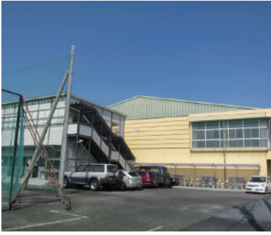
増改築工事が進む佐野中学校

上下水道事業に関する平成22年度決算認定議案も提出され、両議案とも可決されました。収益的収支では水道事業4億7545万8683円、下水道事業6億5942万6732円の純利益がありました。