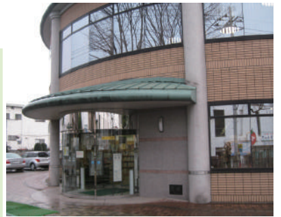
男女共同参画の拠点となる市民活動センターに隣接する群馬図書館

Q 高崎市男女共同参画センター複合施設を生かした事業を！ A 仕事と生活との調和が課題多くの交流が期待できます。