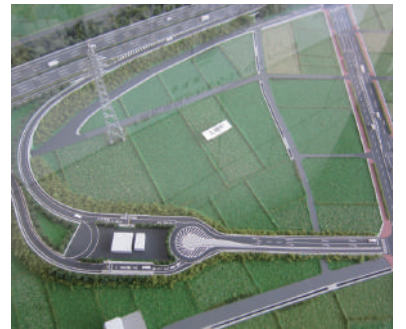
スマートインターチェンジ完成予定模型

既存校舎の南側に、鉄筋コンクリート4階建て校舎を増築し、普通教室、少人数教室、職員室や会議室などが整備されます。一部屋上となつ