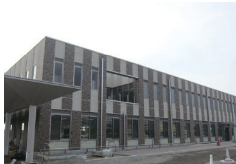
4月のオープンを待つ市民活動センター

高 崎の元気を生み出すには、思い切った事業展開も必要だとは思いますが、教育、福祉環境など、生活に密着したきめ細かな施策も求められます。