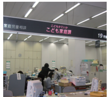
保育園・幼稚園に関する窓口が一元化

答弁 （教育部長）「アレルギー疾患用 学校生活管理指導表」に基づいて、除去食や代替食の提供などを行い、急性アレルギー反応に対処するため、補助治療剤エピペンの