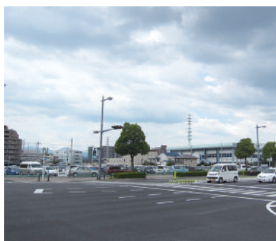
新音楽ホールの建設予定地 (高崎駅東口・栄町駐車場付近)