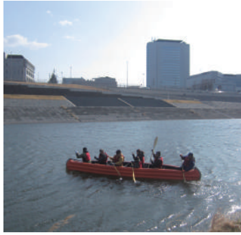
鳥川緑地（高松エリア）の水辺空間

答弁 （都市整備部長）すでに公園や遊歩道の整備が完成。今後は、これらを有機的に結びつけ、水辺空