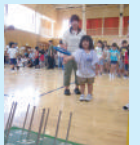
新町第一小学校区 輪投げ大会