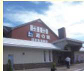
行政視察 (道の駅「流水街道網走」)