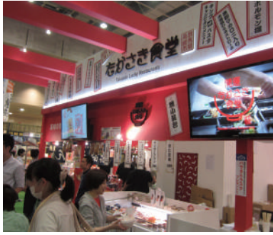
65万人以上が来場した「食博覧会・大阪」

この事業を実施するにあたり、高崎市では昨年7～9月、市内の商店に聞き取り調査を実施。老朽化のためリニューアルが必要と回答した商店のうち5割が、補助があれば実施したいと回答。これを受けての制度設計で、補助率は2分の1、最大100万円まで助成されます。この事