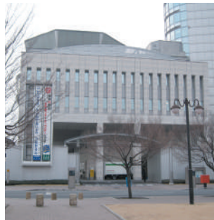
高崎市役所議会棟

会派室(執務室・議員控室)は、高崎市役所議会棟3階にありますので、市役所にお越しの際は、ぜひ立ち寄りください。