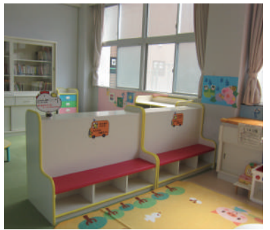
リニューアルした群馬児童館

業は人気が高く、当初予算の1億円の枠は短期間で突破。6月定例会では、さらに2億円増額する補正予算案が可決されています。